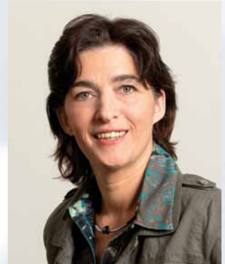
Ministerium für Gesundheit, Emanzipation, Pflege und Alter des Landes Nordrhein-Westfalen